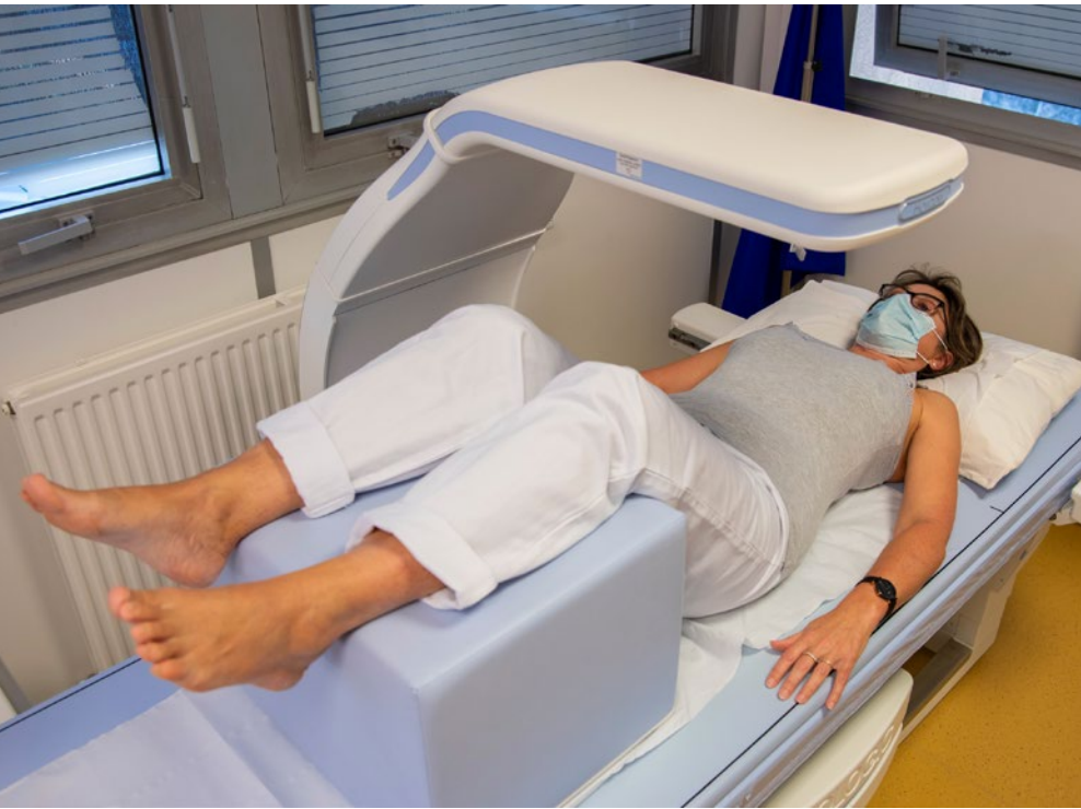
CHU de Poitiers